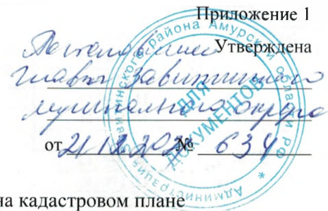
Схема расположения границ публичного сервитута на кадастровом плане